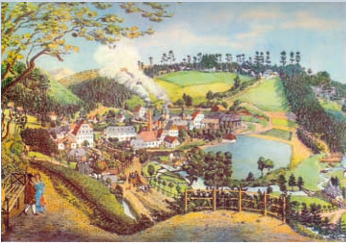
Morgenröthe um 1726 im Zentrum das Hammerwerk mit dem Hohen Ofen

Im 15./16. Jahrhundert zog es immer wieder Bergleute auf der Suche nach abbauwürdigen Erzlagerstätten auch in die steilen Täler am Oberlauf der „Zwickauer Mulde“ und ihrer Nebenflüsse. Es entstanden weitläufige Zinnseifen und einzelne Bergwerke.