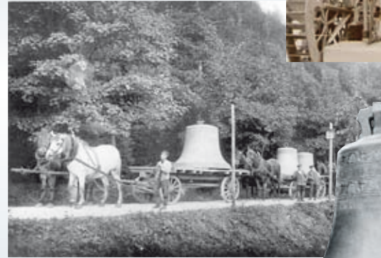
Transport der Glocken von Morgenröthe zum Bahnhof Rautenkranz